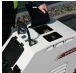
Einfach zu öffnende Klappen für den schnellen Zugang zu täglichen Wartungspunkten