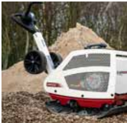
Breite, bruchfeste Räder für einfachen Positionswechsel vor Ort