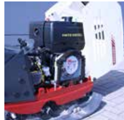
Einfach zu öffnende Haube für unbehinderten Zugang bei Wartungsarbeiten