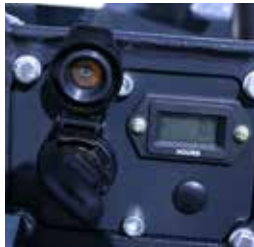
Elektrostart und Betriebsstundenanzeige machen das Leben einfacher!